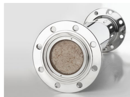
Membrane in Edelstahlgehäuse

BMF-Systeme bieten einzigartige Vorteile durch den Einsatz von PES-Membranen, den optimierten Filtrationsprozess und das ideale Reinigungsverfahren. Der optimierte Filtrationsprozess hält großen Mengen Hefe stand und die Hefe wirkt sich sogar positiv auf die Laufvolumina aus. Aus diesem Grund ist eine Vorklärung des Bieres mit einer Zentrifuge nicht erforderlich. So können Brauereien Investitionen und Energie sparen und teure Wartungskosten vermeiden. Infolgedessen kann eine Brauerei in den Bereichen Nachhaltigkeit und Qualitätspunkten, den Betrieb optimieren und Ausgaben reduzieren.