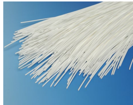
Bündel aus Hohlfasermembranen

Whether operating a small craft brewery or supervising high volume output in the largest breweries, brewers all over the world strive for the best and most consistent beer quality.